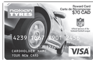
Illustration de la carte prépayée à titre d'exemple seulement. La carte reçue peut être différente de celle représentée ici.

Pour vérifier le statut de votre réclamation: www.NokianTiresRebates.ca .